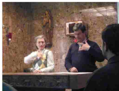
MONITORES DE VÍA CRUCIS