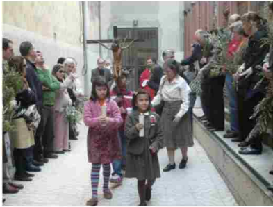
DOMINGO DE RAMOS

Domingo de Ramos: Entrada de Jesús en Jerusalén. Acompañamos a Jesús en el camino de la cruz.