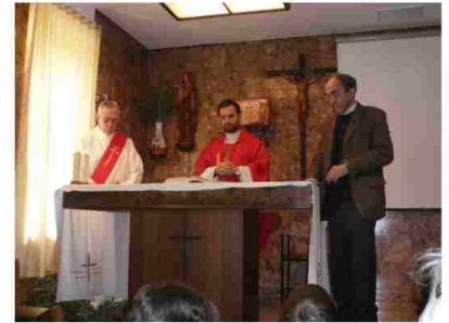
LECTURA DE LA PASIÓN

Jueves Santo: "Amaos los unos a los otros como yo os he amado".