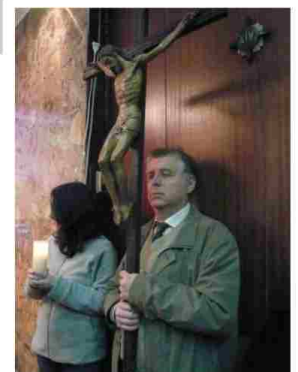
ESTACIONES DE VIA CRUCIS

Vigilia Pascual: Cristo ha resucitado: El amor ha vencido al odio.