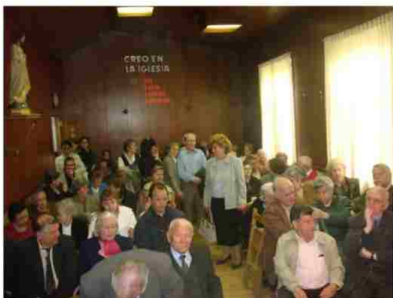
FIELES ASISTENTES JUEVES SANTO

Jueves Santo: "Amaos los unos a los otros como yo os he amado".