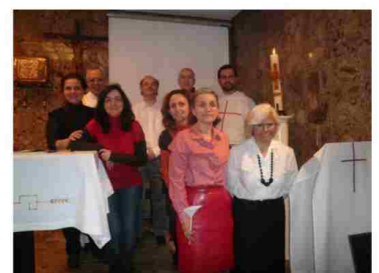
GRUPO DE LECTORES