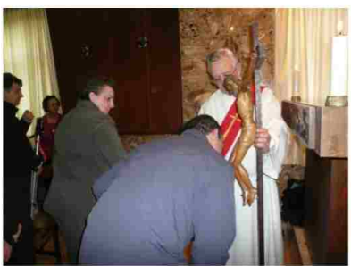
ADORACIÓN DE LA CRUZ

Viernes Santo: "Que se no se haga mi voluntad, sino la Tuya".